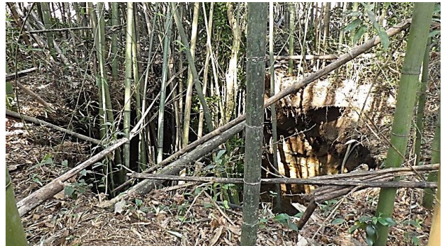
岐阜県・リニア山口工区落盤事故(鉄道・運輸機構)

第15回口頭弁論が2019年7月19日(金)午後2時30分から、東京地方裁判所103号法廷で開かれます。法廷では、原告の適格性について理由を説明するとともに原告側の意見を述べる予定です。また、東京、神奈川の環境保全対策について国の主張に反論することになります。原告側も、これまで同様に多くの皆さんの結集で傍聴席を埋めましょう。午後1時、工事認可取消しへの公正な判決を求める署名(約3万筆)を提出。